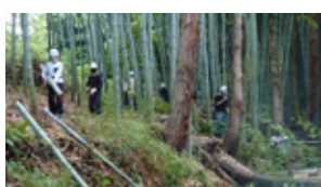
<続>みんなの里、里山の恵み から広がった「みんなのお店」 を一大交流拠点に