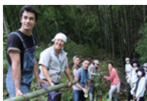
市民と作るサステナブル アート体験プログラム