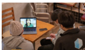
金沢学生ベンチャー教室 ～小売店開業までの道