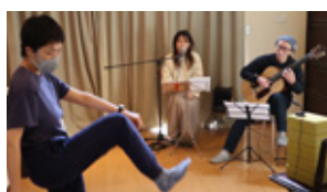
「ダンス・ウェル」オンライン スペシャルクラスの開発