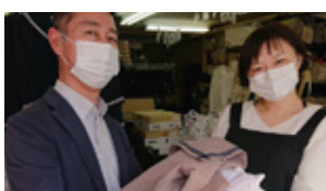
「制服バンク」で広がる おさぎの輪・笑顔の輪・ 地域の輪