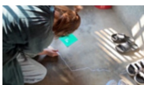
ありのままの金沢を【Part1】魅せる修復、金継でひび割れを直そう【Part2】金沢のナイトカルチャーを豊かにしよう