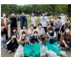
コロナ終息を見越して イマできること