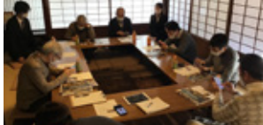
辰巳用水探訪アプリで国史跡 にふれてみよう