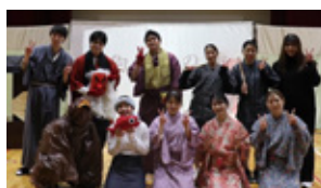
KGU劇場 金沢の民話に親しもう