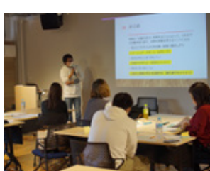
コロナ禍でも金沢の市民活動 を活発にするゲームを作ろう