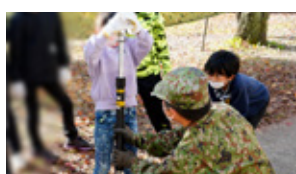
生きる力を育てる自立支援 ～防災教育を通して親子で学ぼう～