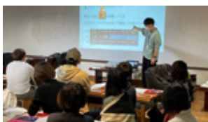
キッズプログラミングスクール 講師人材の育成とプログラミング 講師人材育成事業