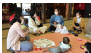
知ろう！触れよう！ パパもママも産後ケア！