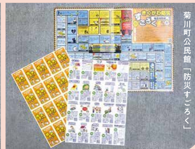
菊川町公民館「防災すごろく」