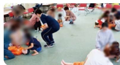
あなたの勇気が命をつなぐ! 自助・共助の社会を創ろう!