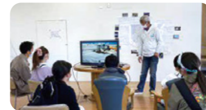
子どもたちが考える2050年問題