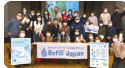
マイボトルでGo!アクション