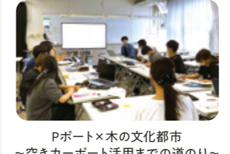
Pポート×木の文化都市 ~空きカーポート活用までの道のり~