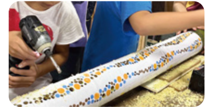
市民と作るサステナブルアート 体験プログラム