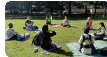
知ろう!触れよう!パパもママも みんなで産後ケア!2022!!