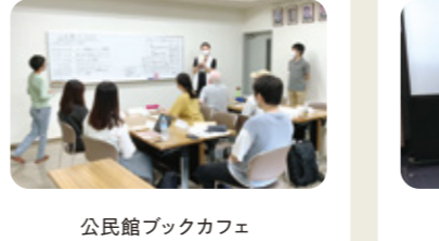
公民館ブックカフェ