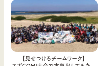
【見せつけろチームワーク】 スポGOMI大会で本気出してみた。