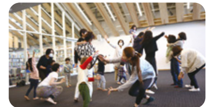
踊る!ライブラリー presented by Dance Well