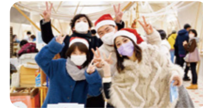
金沢の冬を温める! 金沢クリスマスマーケット開催!