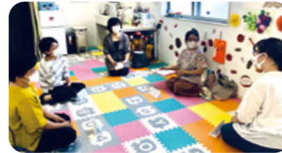
ひとりじゃないよ! ~寄り添う・つなげる相談事業~