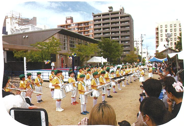
明成小学校5・6年生による鼓笛隊が演奏を披露