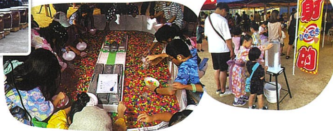
ゲーム縁日コーナーや 屋台も並びます