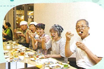
作った料理を味わい、 会話が弾みます