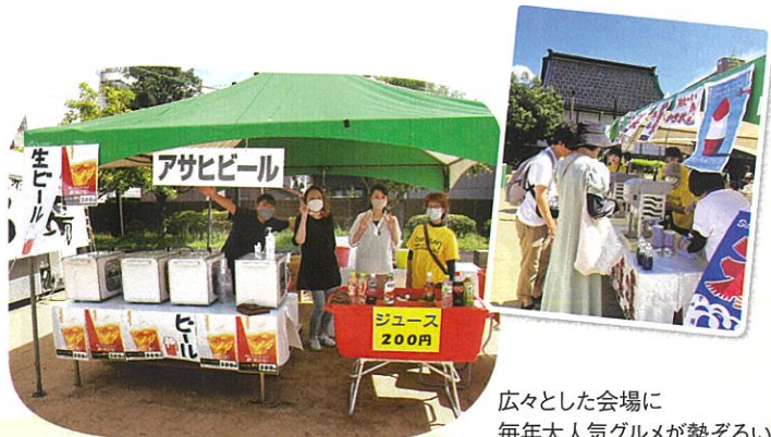
広々とした会場に 毎年大人気グルメが勢ぞろい