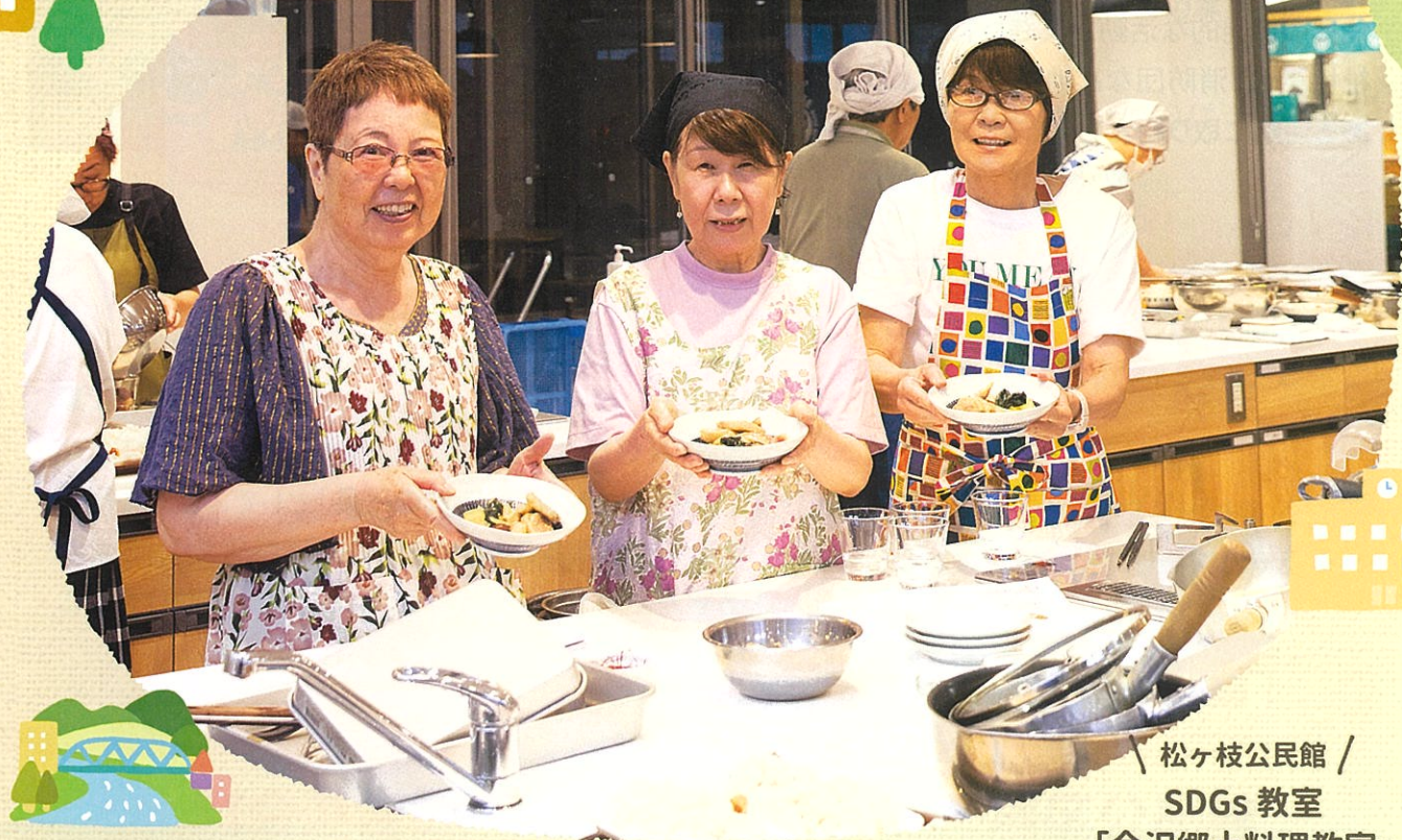
松ヶ枝公民館 / SDGs 教室 「金沢郷土料理教室」