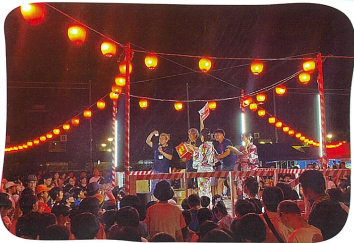
令和7年は8月9日に開催。櫓の上ではダンスや盆踊りを披露