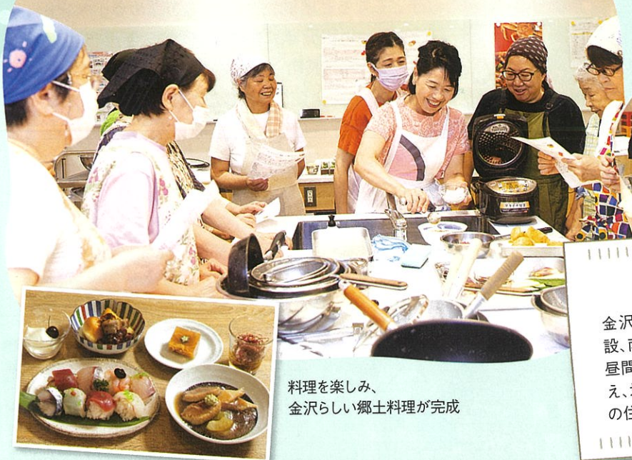
料理を楽しみ、 金沢らしい郷土料理が完成