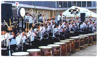
オープニングを飾った 加賀豊年太鼓の演奏