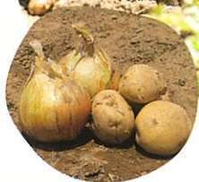
畑で育てられた 玉ねぎとジャガイモ