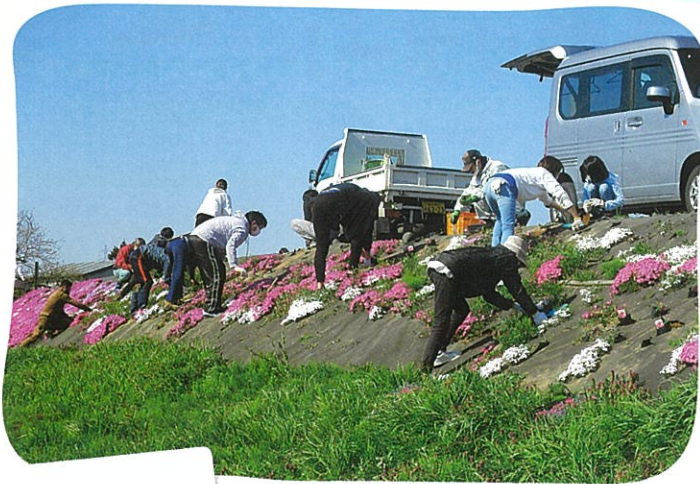
森下川の右岸の約150mにわたり芝桜を植えます

やピンク、白の花が咲き誇り、心を和ませる春の風物詩として多くの人に親しまれています。