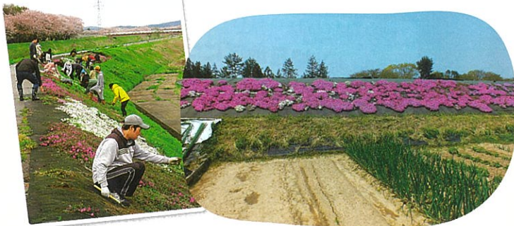
4月下旬より見ごろを迎え、鮮やかな花のじゅうたんが広がります