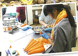
参加者の昼食は 公民館で調理したカレーライス