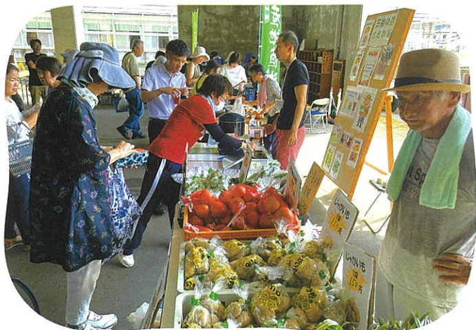
新鮮な野菜を買い求める人たちで大盛況の即売会

カブトムシの販売やうちわ作りなど、子どもたちも楽しめる催しも多く、地区外に出た住民が集う交流の場としても賑わいます。今後はイベントをサポートする大学生や出店する地元のガラス工房とも連携を深め、地域起こしとして盛り上げていく計画です。