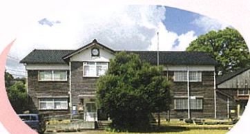
旧校舎が住民の声で残され公民館として再利用

つながる「こどもオンライン交流会」、昼食をはさんだ午後に講師を招いて「アートセラピー体験」を実施しました。