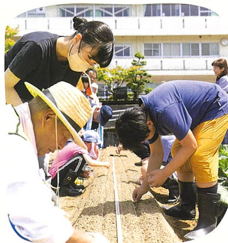
秋の収穫に向けてニンジンの種まき

金沢市の北部に位置し、山間に17の町会が点在しています。地区内には、あじさい寺として知られる本興寺やさまざまな企業が集まる「金沢テクノパーク」があり、一帯にはのどかな里山の景観が広がっています。