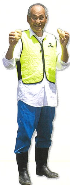
薬師谷地区町会連合会 会長

収穫後は畑に隣接する公民館の駐車場で販売会を実施し、新鮮な野菜を求める人で賑わいます。厨房では高校生と高学年の児童がカレーをつくり、参加者全員で昼食をとります。秋に向け、ニンジンの種まきも行われ、防災訓練の炊き出しに使われる予定です。