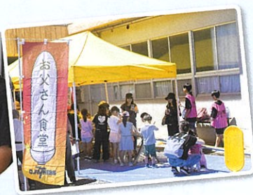
ファザーズによる お父さん食堂 この日は父親だけでなく 母親も助っ人として参加