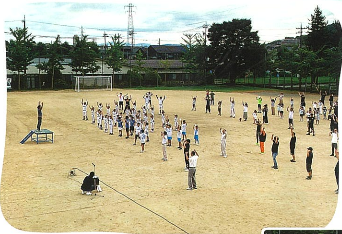
夏休みの始まりを告げる恒例行事です