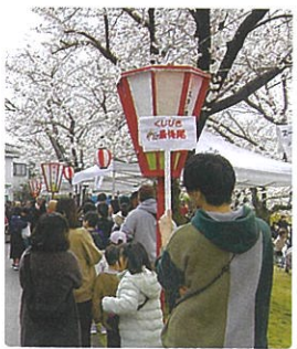
会場に設置したばんぼりが お花見ムードを盛り上げます

毎年4月、伏見川沿いの久安新橋上手緑地にて、今年で28回目を迎えるみんな桜まつりを開催しております。周辺は桜の名所でもあり、満開の桜の下に多くの住民が集まって春のひとときを楽しみます。祭りは三馬校下各種団体連絡協議会が主催し、町会連合会会長を実行委員長として、町会が協力して実施しています。茶店では和菓子とお茶の提供もあり、花見気分を味わえます。また、「泉じょんがら」など、地域に根付いた踊りも披露され、子どもたちにとっても世代を超えた交流を体験できる機会となっています。