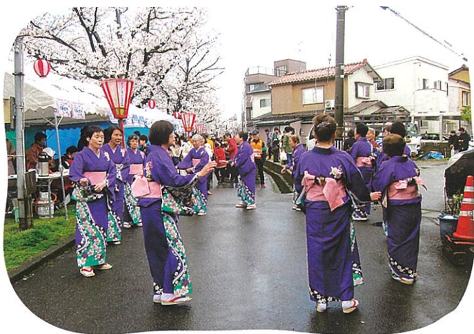
伝統の「泉じょんがら」の輪踊りがお祭りを彩ります