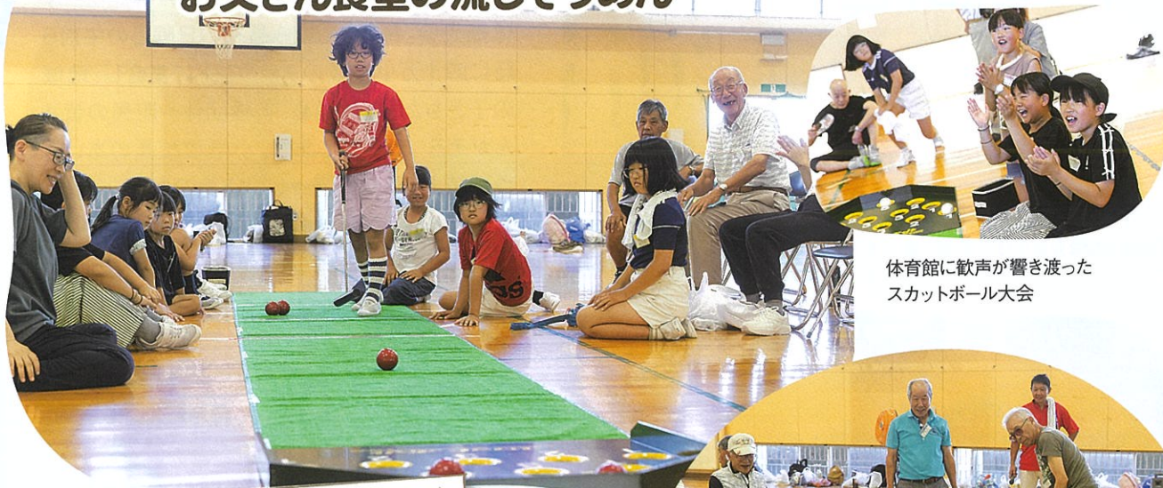
体育館に歓声が響き渡った スカットボール大会