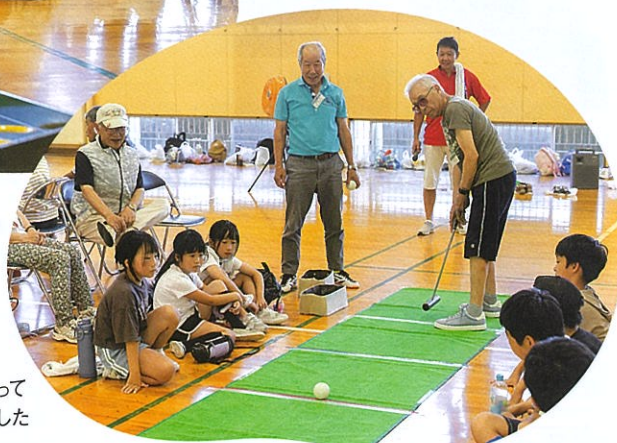
チーム一丸となって 優勝を目指しました

夏休み初日の朝、金沢市立扇台小学校のグラウンド で恒例の合同ラジオ体操が行われました。この行事 は、夏休みを規則正しく過ごすきっかけづくりとして、 開館間もない頃から続いています。