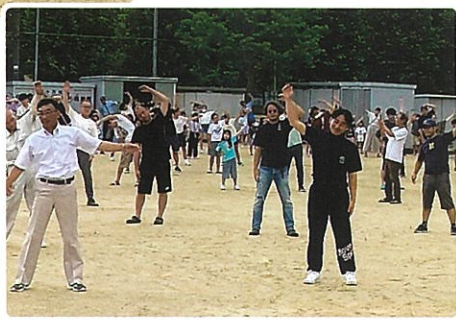
子どもも大人もラジオ体操で さわやかな一日のスタート