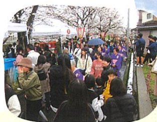
久安橋上手緑地に 桜並木が続く