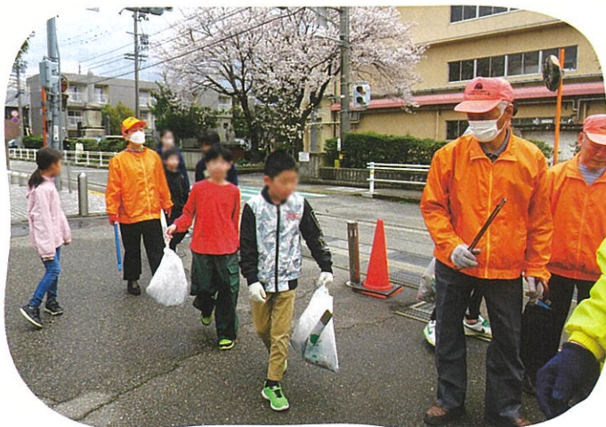
通学路の清掃活動。集めたごみは公民館の駐車場に集積します