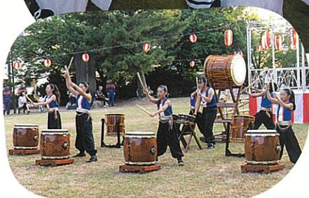
子どもたちによるチカモリ太鼓の演奏