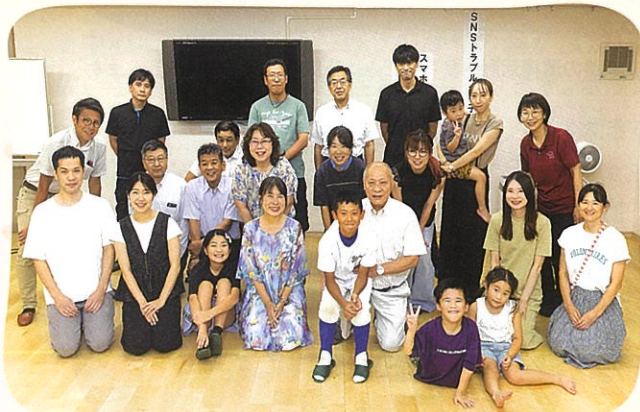
講師と参加者で記念撮影

今回の講座を開くにあたり、子ども会や育友会に協力を依頼し、両者とのつながりがより密になったことで、秋の文化祭など、今後の公民館行事において連携を生かしたスムーズな運営体制の実現が期待されます。米丸公民館では、学習、コミュニケーションの場として、公民館としての役割を果たすため、今後もさまざまな角度から親子で学べる場を提供していきます。