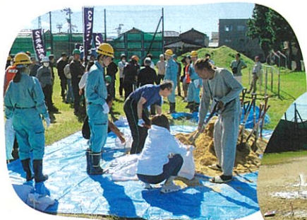
土のう積みの訓練、初期消火訓練を実施