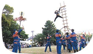
金沢第一消防団押野分団 による「加賀鳶はしご登り」

チカモリジョンガラは、約800年前の鎌倉、室町時代から伝わる民謡踊りです。戦後に一度途絶えましたが、平成元年に住民の手で復活し、今では西南部校下全体で受け継がれています。