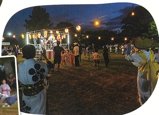
宵闇とともに祭りは最高潮へ

西南部地区は、住宅地と里山が共存する地域です。子育て世代から高齢者まで、約1万人の住民が支え合いながら暮らしています。縄文時代の遺跡も残り、古くからの歴史や伝統文化は、住民の大切な誇りです。