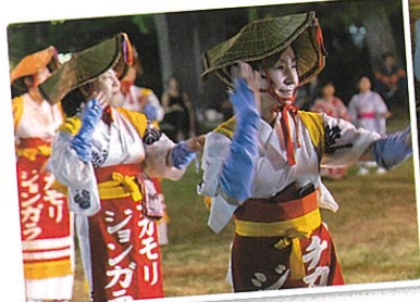
そろいの梅鉢の浴衣や菅笠姿で 伝統のチカモリジョンガラを踊る