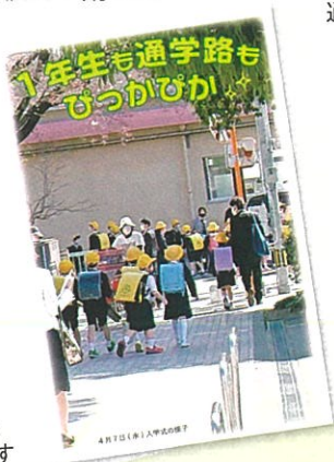
きれいで安心な通学路を歩き、新一年生は入学式へ向かいます

押野小学校の入学式前の日曜日、校下全体で通学路の清掃活動を行っています。それぞれの自宅から小学校に向かって歩きながら、側溝や道路わきに落ちているゴミを拾う取り組みです。新一年生がきれいな通学路を気持ちよく歩けるように、そんなお祝いの気持ちを込めて実施しています。ゴミの中には、車の部品や割れたビン、汚れた空き缶、ビニール傘などさまざまなものがあり、新一年生はもちろん、地域全体の安全にもつながります。この活動には、毎年多くの住民が参加し、押野校下の恒例の行事となっています。