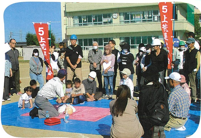
AEDの使用方法を地域の住民や子どもたちが熱心に聞き入る