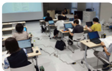
令和5年度「地域活動デジタル活用講座」(7月)

今後もデジタル技術を活用して、校下内のコミュニティの一層の活性化や、より幅広い世代が深いつながりをつくれるよう、積極的に取り組んでいきたいです。