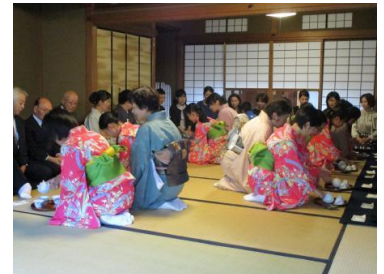
こども茶会体験イメージ

将来、伝統文化及び工芸技術を担う子どもたちが、実際に芸術文化にふれる体験やステージプログラムを経験することで、伝統文化や工芸技術の裾野拡大や後継者育成を図ります。