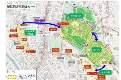
加賀百万石回遊ルート

金沢城鼠多門及び鼠多門橋の完成により、長町武家屋敷跡から金沢城、兼六園、本多の森公園に至る加賀藩ゆかりの歴史的回遊ルートが形成されることを受け、ルートに点在する多様な歴史的建造物等の情報発信等を図り、本市の歴史的風致の核である金沢城、兼六園を中心とした周辺環境の魅力向上へ繋がります。