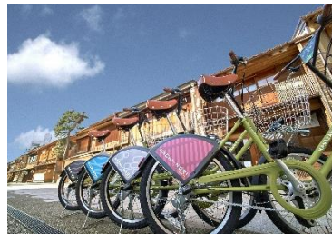
公共シェアサイクル「まちなり」

歴史的風致の重点区域を回遊する手段としてのシェアサイクル「まちなり」について、電動アシスト化、ポートの充実、IoTを活用した案内機能の強化などにより利便性を高め、市民及び観光客が歴史的な街並みを快適かつ効率的に周遊することを可能とすることで、歴史的風致の理解促進を図ります。