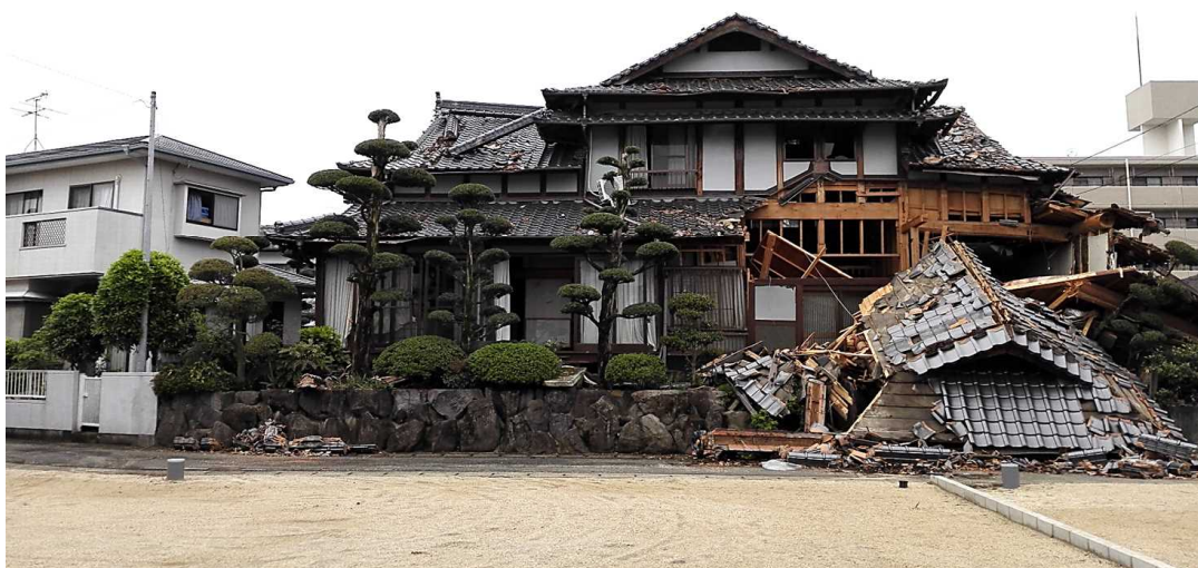
平成 28 年 熊本地震での被害状況