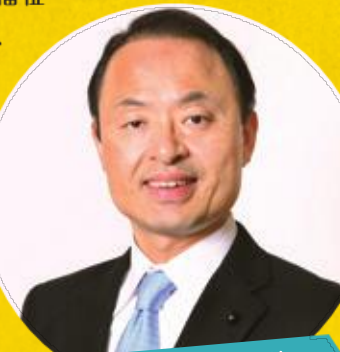
金沢市長 山野 之義