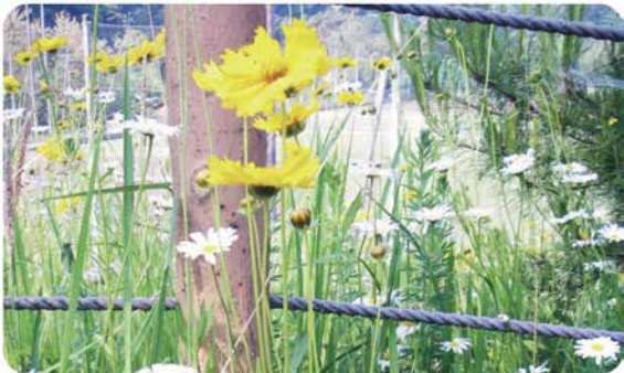
6月に1回目の刈り取り