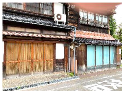
鶴来街道沿いの空き7店舗