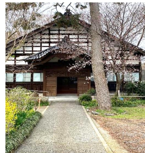
寺子屋の机が懐かしい

日中通りを歩くのは外国人観光客が中心で、地域の日常の息遣いは感じにくくなっています。観光地でありながら、飲食店の数も極めて少なく、地域内での消費や人の流れが十分に循環していない状況 高齢化で閉店(若い方へ時間貸しの検討、活性化)