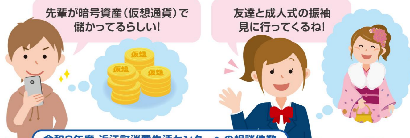
令和3年度 近江町消費生活センターへの相談件数