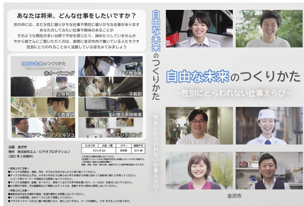
キャリア教育支援DVD