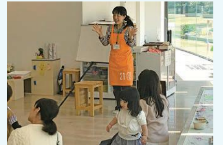
<金沢 21 世紀美術館キッズスタジオ>

さくらっこでは、未就園児のママが育児に煮詰まらないように、今しかない親子の時間を大切に過ごせるように、託児サービスや遊び場の提供、親子イベントの開催などをおこなっています。