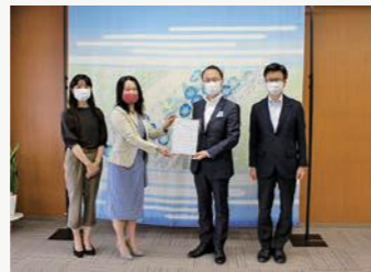
一般社団法人石川県建築士会 金沢支部企画委員会女性部会

今年度は、新たに2団体が、自らの業界の課題、改善策を検討し、業界一丸となって取り組むべき具体的な方策を取りまとめ、決意表明である「取組宣言」を行いました。他業界団体への機運の波及や取組拡大につながっていくことを期待しています。