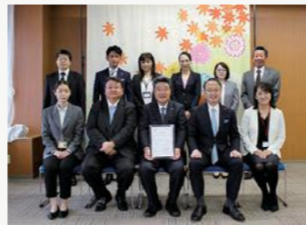
一般社団法人石川県木造住宅協会