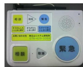
高齢者見守り装置