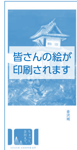
●バナーフラッグイメージ