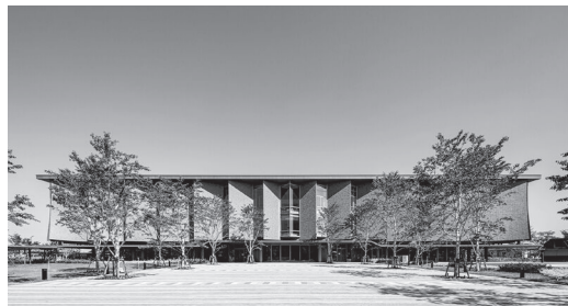
石川県立図書館

金沢市小立野に建設された石川県立図書館(2022年竣工)と金沢美術工芸大学(2023年竣工)の建築的魅力を紹介すると共に、この2つの施設を「知と美の拠点」として一体的に捉え、周辺の街と共に金沢の創造力向上に寄与する場に育つことを願い考えます。