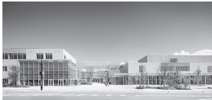
金沢美術工芸大学