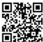
【市公式YouTubeチャンネル】