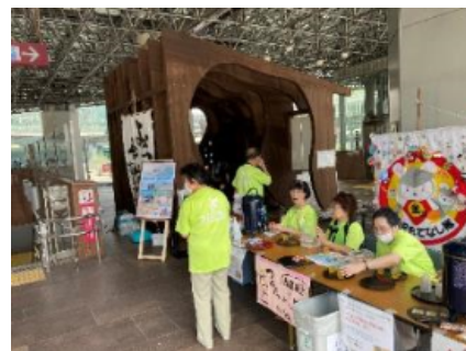
令和6年度のイベントの様子

令和7年5月31日(土) 7月12日(土) 8月9日(土) 9月13日(土) 10月11日(土) 11月8日(土) の6日間