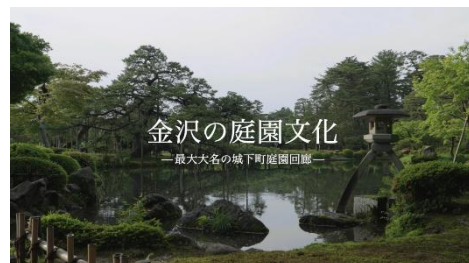
【動画「金沢の庭園文化」イメージ】