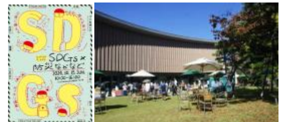
KANAZAWA SDGs フェスタ