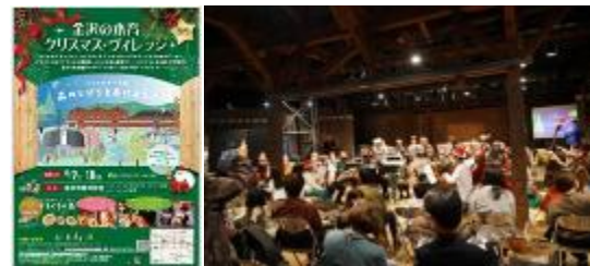
金沢の森育クリスマス・ヴィレッジ