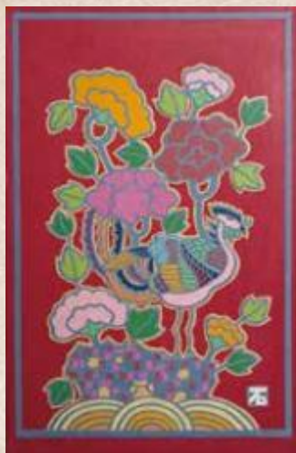
鳳凰(額) / 許石熙 (ホ・ソッキ)