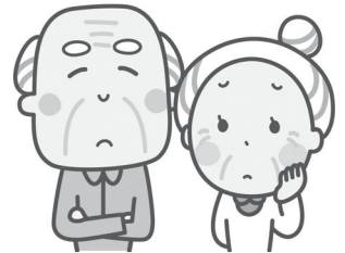
70歳以上の方のご自宅を訪問し、調査をします

個人市・県民税の第2期の納期限は8月31日(火)です 🏠 市民税課 ☎220-2161