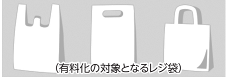
(有料化の対象となるレジ袋)

対象 購入した商品を持ち運ぶために用いる、持ち手のついたプラスチック製買物袋(レジ袋)