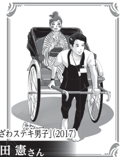
『かなざわステキ男子』(2017)