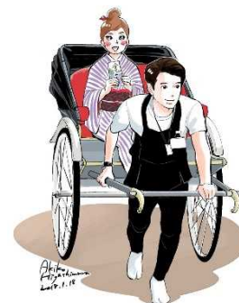
(参考) 昨年の「かなざわステキ男子」と東村アキコさんイラスト