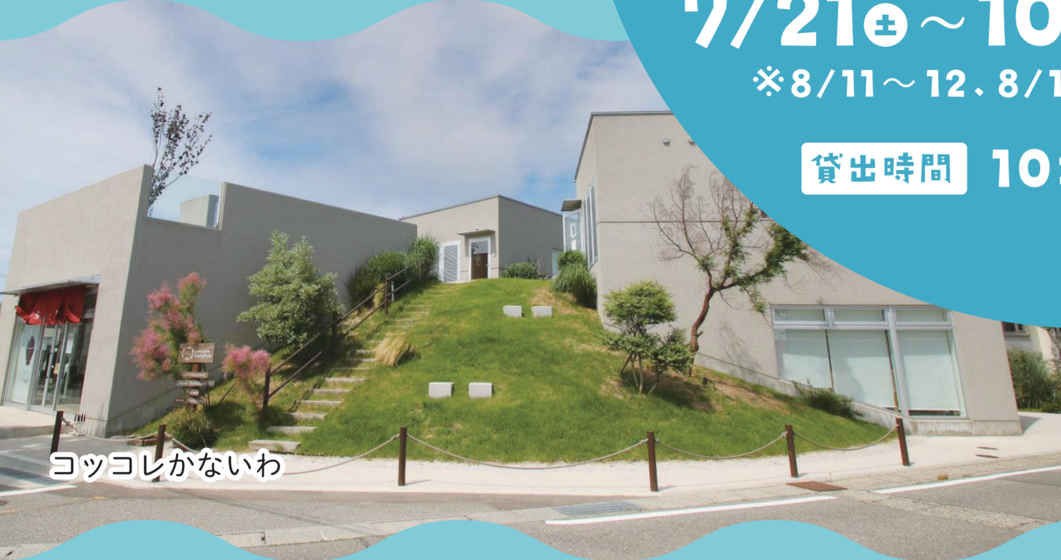
コッコレかないわ