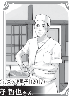
『かなざわステキ男子』(2017)