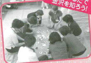
食育かるたで 金沢を知ろう!