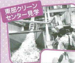
東部クリーン センター見学