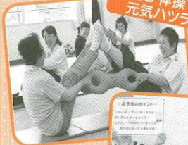
3B体操で 元気ハツラツ