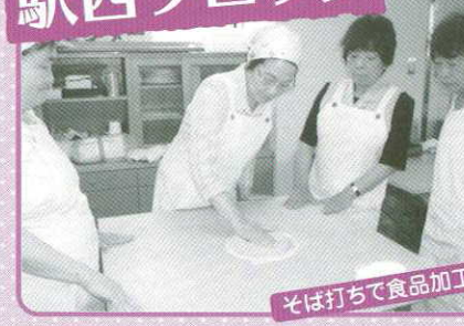
そば打ちで食品加工を知る