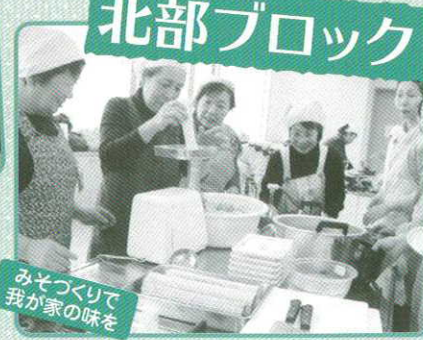
みそつくりで 我が家の味を