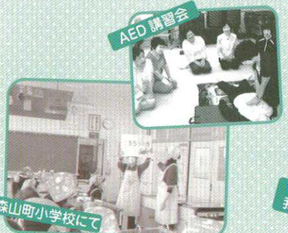
森山町小学校にて