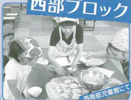
西南部児童館にて