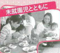
未就園児とともに