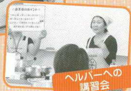
ヘルパーへの 講習会