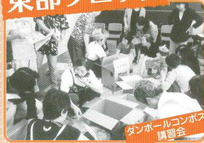
タンホールコンポスト 講習会