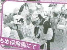
かもめ保育園にて