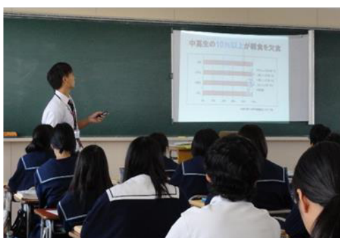
辰巳丘高校での授業風景①