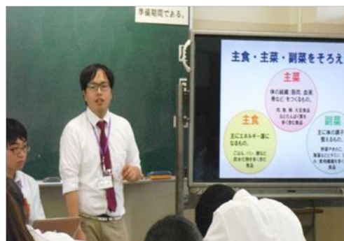
北陵高校での授業風景②