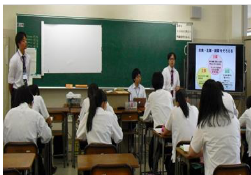
北陵高校での授業風景①