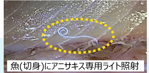
魚(切身)にアニサキス専用ライト照射