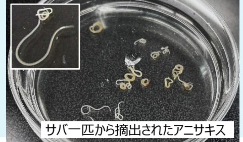
サバ一匹から抽出されたアニサキス