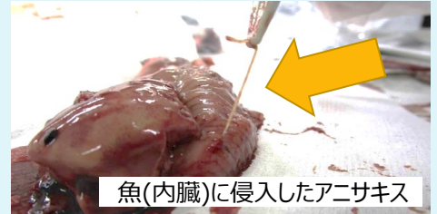
魚(内臓)に侵入したアニサキス