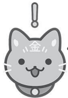
金沢市動物愛護マスコットキャラクター かなにゃん