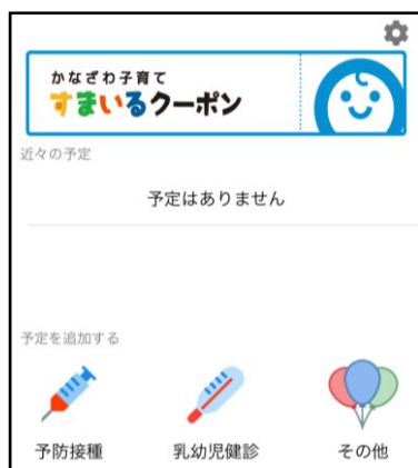
アプリトップ画面