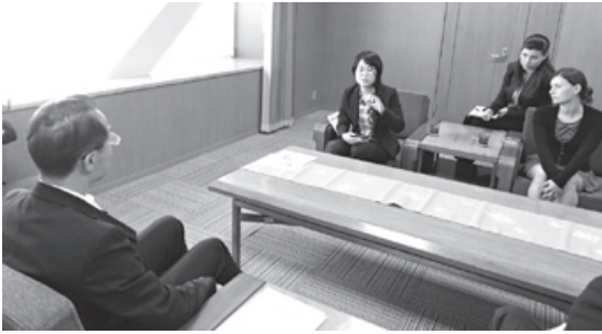
交換留学生の受入・派遣