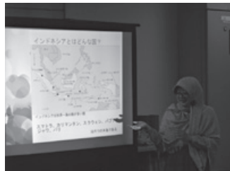
世界の今を知ろう「インドネシア」