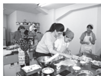
親子でフランスのお菓子教室