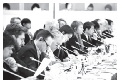
日本語と英語、フランス語の同時通訳を提供