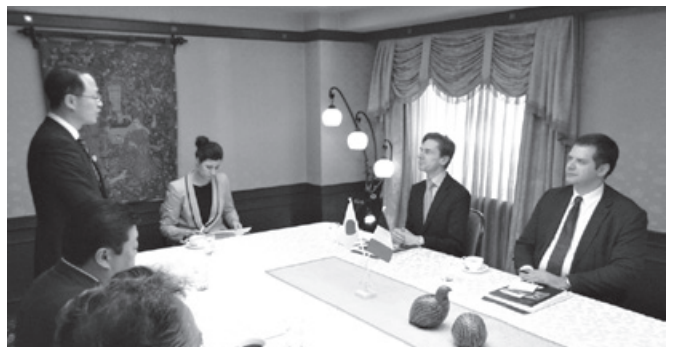
在日フランス大使館政務参事官・在京都フランス総領事来訪