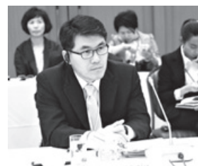
市長ラウンドテーブルに全州副市長がパネリストとして参加