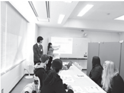
市職員による講義（テーマ：建築文化）

研修生は研修修了日に金沢市国際交流特使に任命され、帰国後、SNSや現地でのイベントなどで金沢の魅力を発信します。さっそく、ポルト・アレグレの研修生が、ブラジルの金沢魅力発信拠点「金沢友の会」のホームページやリオグランデスル連邦大学のホームページで、金沢の魅力について、魅力を発信してくれています。