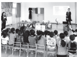
大桑保育所での講座（11/5）の様子