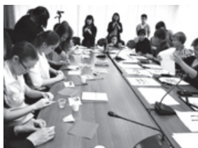
ユーラシア言語大学でのワークショップ