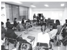
金沢大学での学生交流