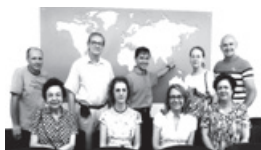
ポルト・アレグレ市内に金沢の魅力を紹介するサントス協会