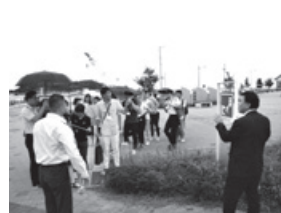
避難所案内板視察