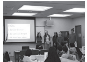
世界のクリスマスとお正月を知ろう