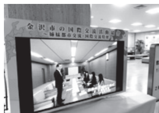
エントランスホールに設置されたデジタルサイネージ

また期間中の12月17日には、グローバル人材育成事業（p.3参照）の一環としてイルクーツ市から来沢し、市庁舎を訪れていた学生らを対象にして、デジタルサイネージを活用して、ウェルカムメッセージや交流の様子を画像で写し出して歓迎する試みも行われました。