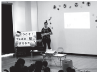
薬師谷保育所での講座（10/16）の様子