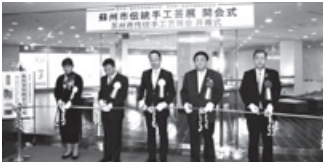
「蘇州市伝統手工芸展」開会式