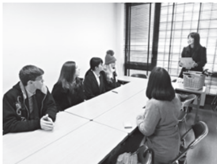
日本人学生との交流（金沢大学訪問）