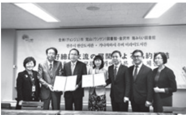
海みらい図書館が全州市完山図書館と提携交流合意書を締結