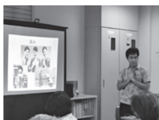
魅惑の国タイをもっと知ろう