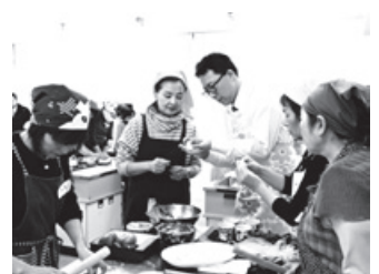
中国文化紹介講座