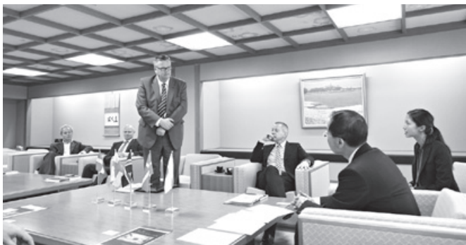
駐日北欧4カ国大使来訪