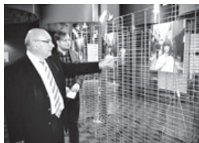
ゲントでの展覧会に訪れたテルモント市長

金沢市とゲント市の若手アーティストによる交流プロジェクトとして、ゲント市を中心に活動するアート団体INARIが、両市で同時に作品展を開催することを企画したもので、両市の協力のもと実現しました。作品展のテーマは、プロジェクトに参加する両市の若手アーティストが、相手のまちの著名アーティストを題材として選び、そのアーティストの作品から受けたインスピレーションで作品を制作するというもので、ゲントでの展覧会では、金沢美術工芸大学の学生6名の作品を中心に展示(期間:4月10日~17日)されました。また同時に開催された金沢での展覧会では、プロジェクトに参加した金沢美大生の協力のもと、ゲント王立美術アカデミーの学生10名の作品を中心に展示(期間:4月12日~17日、会場:金沢学生のまち市民交流館)されました。