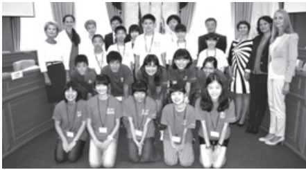
表敬訪問後の記念撮影(8月 中学生親善団)