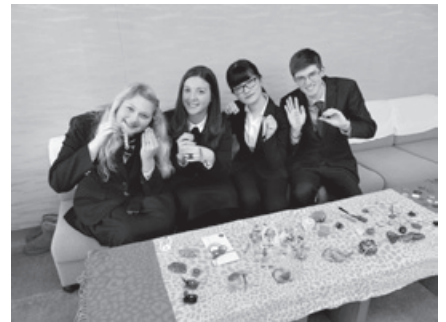
ボランティア講師による水引体験