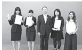
特使任命式での記念写真

8月24日、特使養成塾を受講した外国人留学生のうち2016年9月に留学を終え帰国する5名の方を、初代国際交流特使として任命しました(写真は、当日所用で1名欠席のため留学生4名が写っています)。