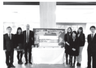
ウェルカムボードでの記念撮影