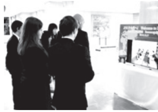
ウェルカムボードに見入るイルク学生ら