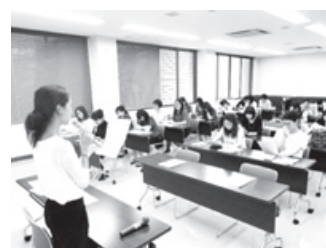
市文化施設職員英会話研修の様子