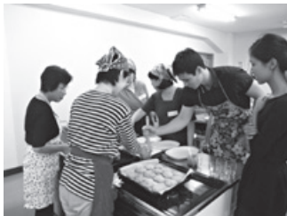
英語でワールドクッキング「オーストラリア」