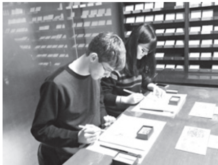
ひがし茶屋街にて金箔体験