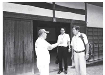
長町武家屋敷跡視察