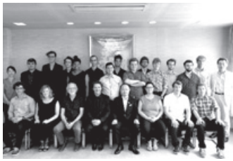
表敬訪問時の記念撮影 (ゲント・ユース・ジャズ・オーケストラ)