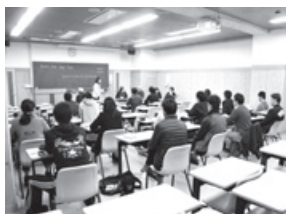
金沢星稜大学での授業参画