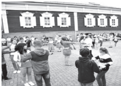
ホストファミリーとの交流会

団員は、交流を通じて新しい友人を作ったほか、姉妹都市に関する理解を深め、たくさんの思い出を持って4日に金沢市へ戻りました。