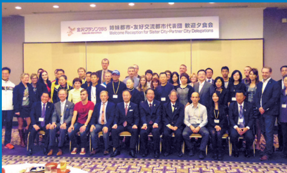
「金沢マラソン2015」に全姉妹都市・友好交流都市から代表団が参加！