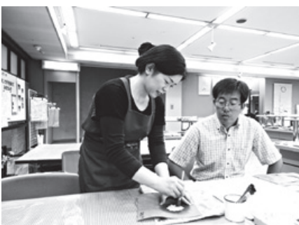
加賀友禅型染め体験

金沢市日中友好協会の交流も行いました。帰国後は、先生が蘇州大学の学生に金沢での滞在の様子を紹介し、金沢の魅力をPRしました。