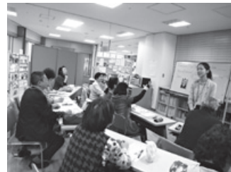
シニアのための初めて英会話