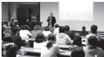
オグル教授による美大での講演会の様子