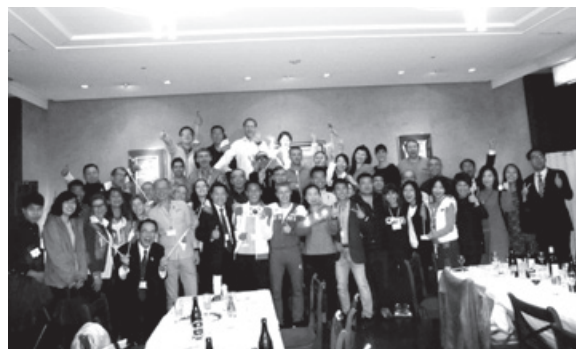
出走後の送別夕食会で盛り上がる参加団の面々