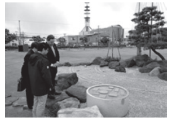
出展庭園を視察する公使参事官

ント・フローラリア2016」に、姉妹都市提携45周年記念事業の一環として庭園を出展するにあたり、2015年11月21日から29日までの間、出展庭園を姉妹都市公園内で一般公開しました。