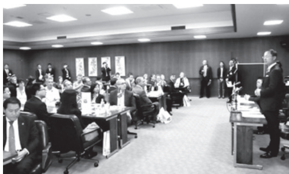
出走の前に金沢市長及び金沢市議会議長を表敬訪問