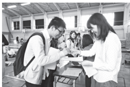
ロールプレイングの様子

当日は、地域住民らが集まる中、韓国、中国出身の留学生ら6名の外国人住民が参加し、各種訓練に参加したほか、シナリオに沿って、「避難所多言語対応冊子」で日本人学生ボランティア（リーダー養成塾メンバー）とコミュニケーションをとりながら、避難所入所受付から応急救護所での応急手当までの一連の流れをロールプレイングしました。