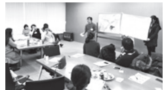
金沢の魅力発信をテーマに発表

国際交流特使養成塾は留学生を対象にしたものであるが、全国の国際交流員にも金沢の魅力を知ってもらうため、中国国際交流員のネットワークを活かし、全国で働く中国国際交流員9名を、1月9日～10日の日程で金沢に招へいしました。滞在中、参加した国際交流員は市内の観光地を巡ったほか、加賀友禅の型染めや加賀友禅の着用、金箔貼りも体験し、その内容をSNSで世界に発信しました。