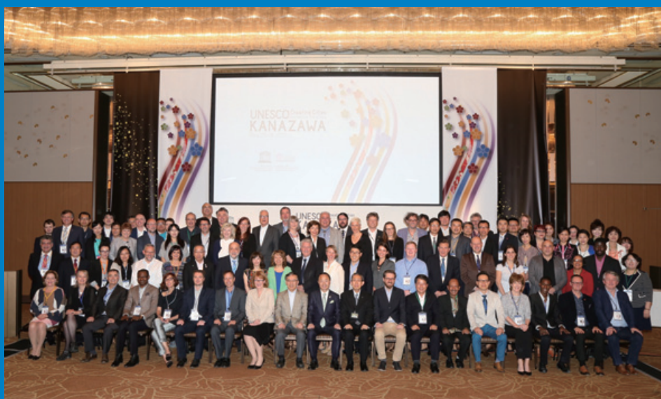
「ユネスコ創造都市ネットワーク会議金沢2015」に姉妹都市含む創造都市が世界から終結！