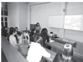
バイカル経済法科大学でのプレゼン