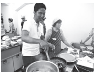
英語でワールドクッキング「ミャンマー」