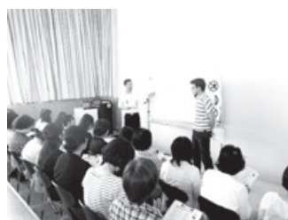
21世紀美術館スタッフ英会話研修の様子