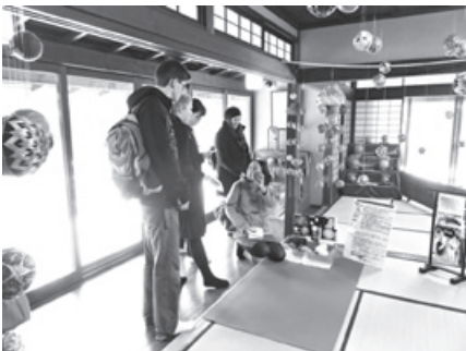
金沢市老舗記念館視察