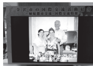
国際交流特使の活動紹介