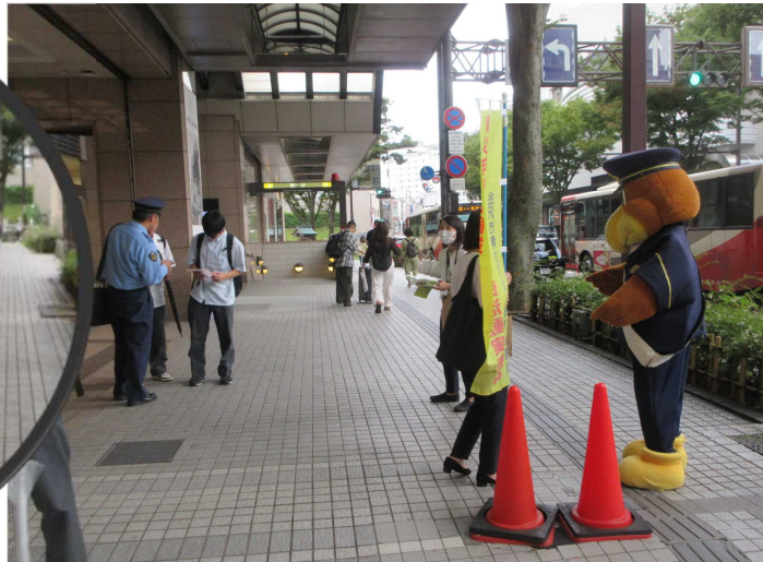
香林坊 アトリ才前