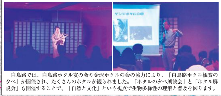
白鳥路では、白鳥路ホタル友の会や金沢ホタルの会の協力により、「白鳥路ホタル観賞の夕べ」が開催され、たくさんのホタルが観られました。「ホタルの夕べ朗読会」と「ホタル解説会」も開催することで、「自然と文化」という視点で生物多様性の理解と普及を図ります。

—みなさんへのお願い— 観察場所では、マナーを守って観察してください。 ホタルは成虫になってから、およそ1~2週間しか生きることができません。 この間に産卵し、一生を終えます。捕まえて持ち帰ると、数が減少してしまいますので、見て楽しんで、観察するだけにしてください。