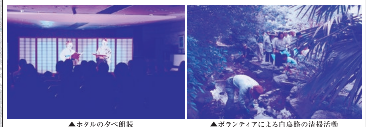
▲ホタルの夕べ朗読 ▲ボランティアによる白鳥路の清掃活動 白鳥路では、「白鳥路ホタル友の会」や「金沢ホタルの会」などの協力により、毎年「ホタル観賞の夕べ」が開催され、たくさんのホタルが観られました。同時に「ホタルの夕べ朗読会」と「ホタル解説会」も開催し、「自然と文化」という視点で生物多様性の理解と普及を図っています。

—みなさんへのお願い— 観察場所では、マナーを守って観察してください。 ホタルは成虫になってから、およそ1~2週間しか生きることができません。 この間に産卵し、一生を終えます。捕まえて持ち帰ると、数が減少してしまいますので、見て楽しんで、観察するだけにしてください。