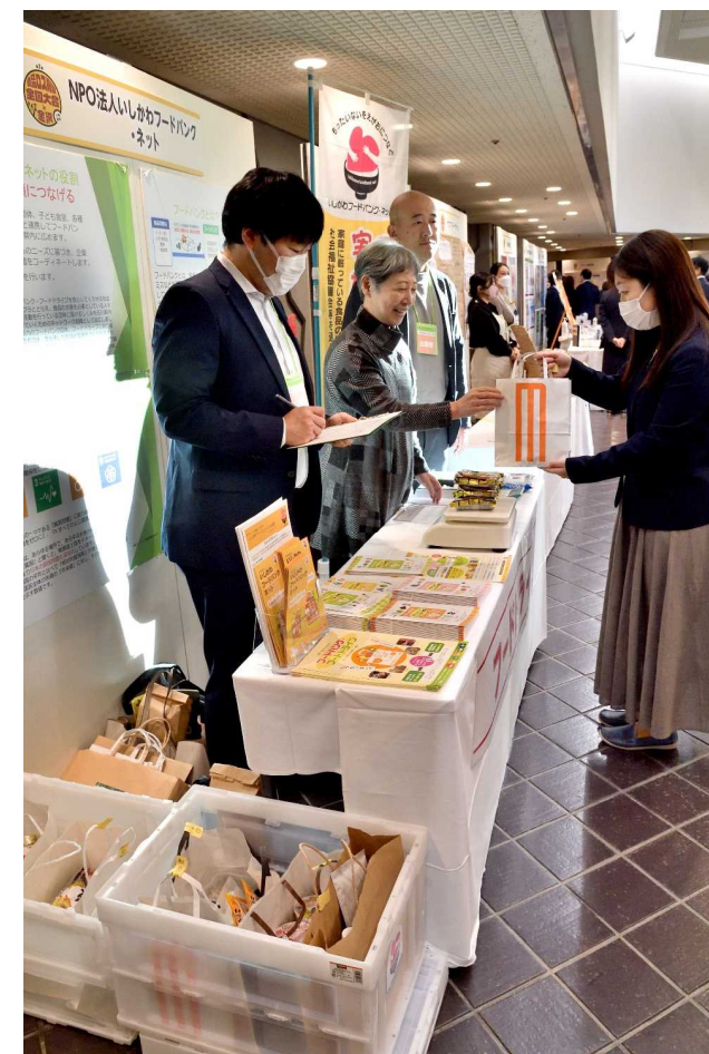
〔フードドライブ受付の様子〕