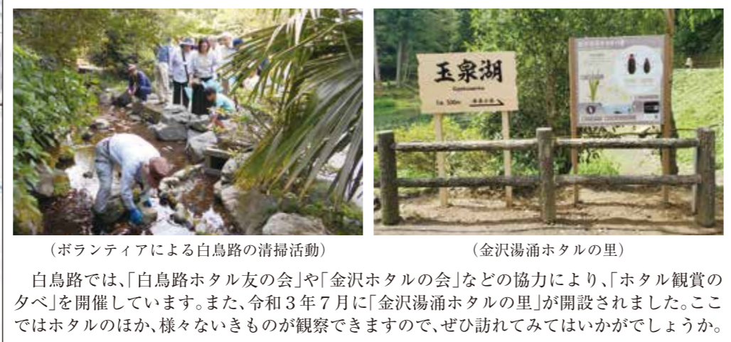
(ボランティアによる白鳥路の清掃活動) (金沢湯涌ホタルの里) 白鳥路では、「白鳥路ホタル友の会」や「金沢ホタルの会」などの協力により、「ホタル観賞の夕べ」を開催しています。また、令和3年7月に「金沢湯涌ホタルの里」が開設されました。ここではホタルのほか、様々な生きものが観察できますので、ぜひ訪れてみてはいかがでしょうか。

—みなさんへのお願い— 観察場所では、観察マナーを守ってください。 ホタルは成虫になってから、およそ1~2週間しか生きることができません。この間に産卵し、一生を終えます。 捕まえて持ち帰ると、数が減少してしまいますので、見て楽しんで、観察するだけにしてください。