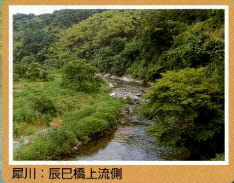
犀川：辰巳橋上流側