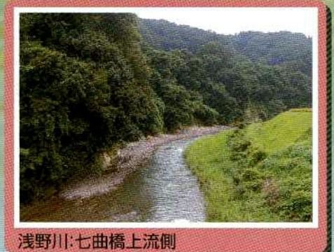
浅野川：七曲橋上流側

金沢市には、犀川や浅野川をはじめとした、たくさんの川が流れており、市の北部には、石川県で一番大きい潟の河北潟があります。川の中や水辺には、魚や鳥などたくさんの生きものがすんでいます。身近なところでいっしょにすんでいる生きものを知り、地域の自然を大切にしましょう。