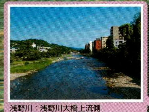
浅野川：浅野川大橋上流側