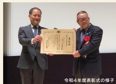
令和4年度表彰式の様子

消費者等に対し広く普及し、食品ロスの削減に効果的かつ波及効果が期待できる、食品ロス削減の推進に資する取組を行った者に対して表彰を行うことにより、食品ロス削減の取組を広く国民運動として展開していくことを目的として、表彰を行います。