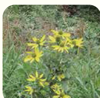
オオハンゴンソウ※①