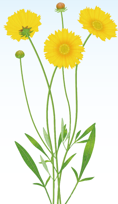
オオキンケイギク (キク科 多年草)