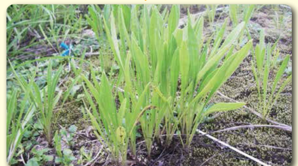
8月に2回目の刈り取り