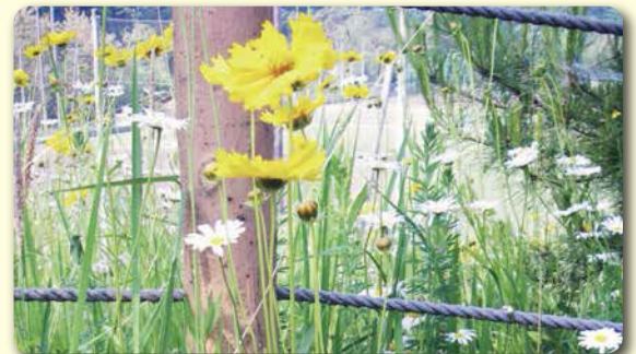
6月に1回目の刈り取り

6・8月の2回刈り取りを 数年間行うことにより、 ほとんどのオオキンケイ ギクを駆除することが できます。