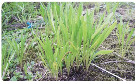
8月に2回目の刈り取り

6・8月の2回刈り取りを数年間行うことにより、ほとんどのオオキンケイギクを駆除することができます。