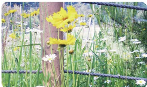
6月に1回目の刈り取り