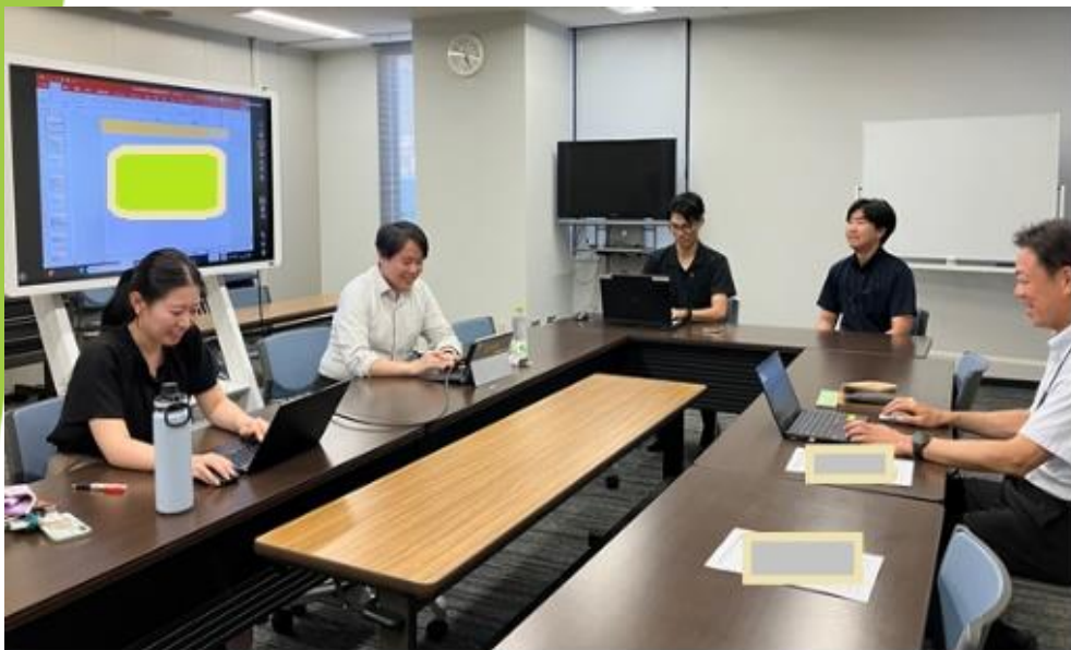
【会議状況（ペーパーレス）】