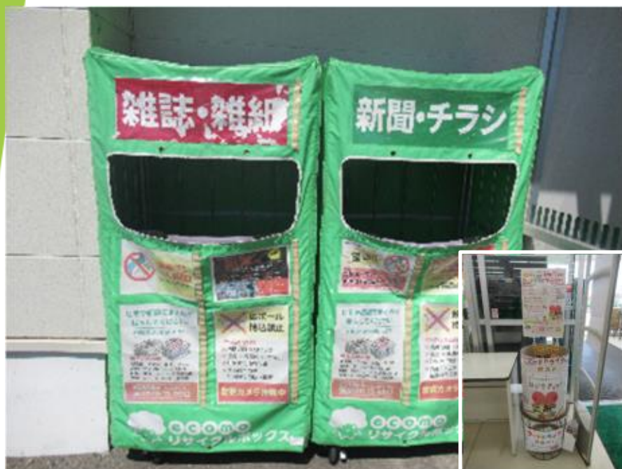
【古紙等の回収ボックス】