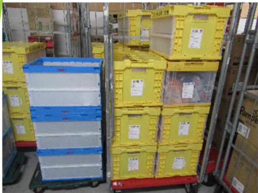
【配送時に使用するコンテナ】