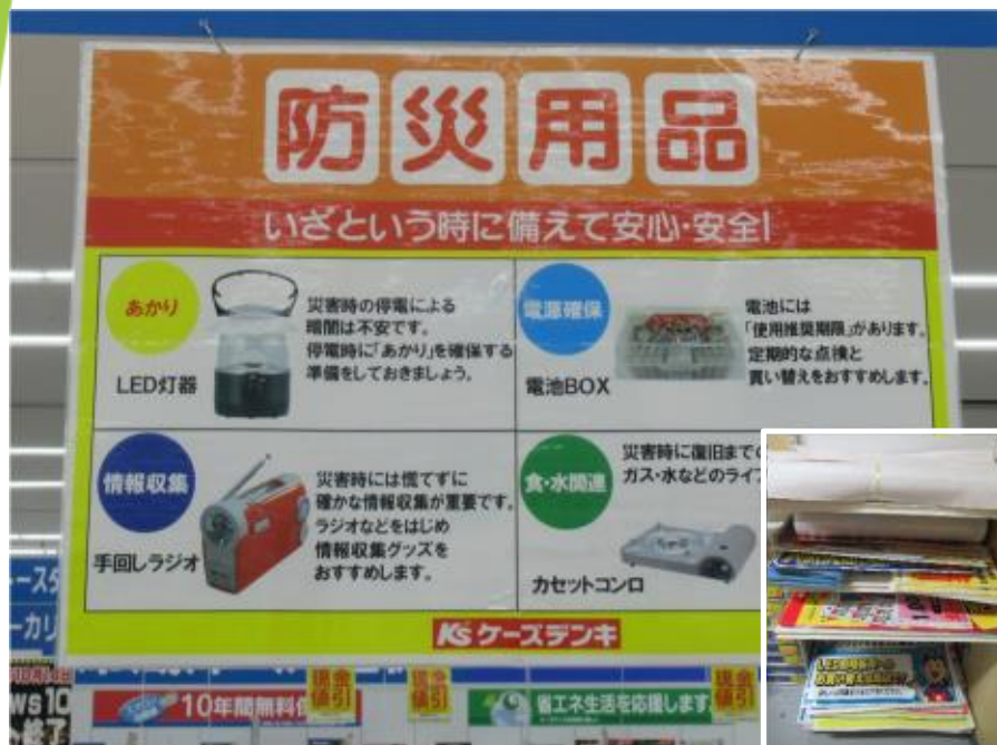
【チラシ・ポップを繰り返し利用】