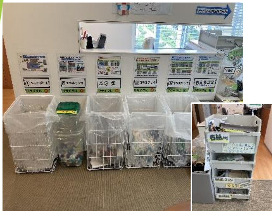
【分別ボックスの見える化】