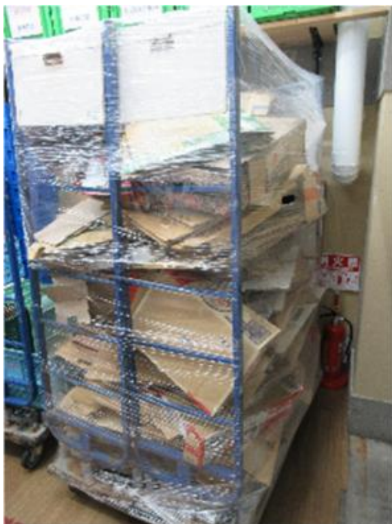
【古紙の集積状況（配送）】

《取組》 古紙を分別後、富山高岡センターに集約 まとめて処理することによりリサイクルを推進