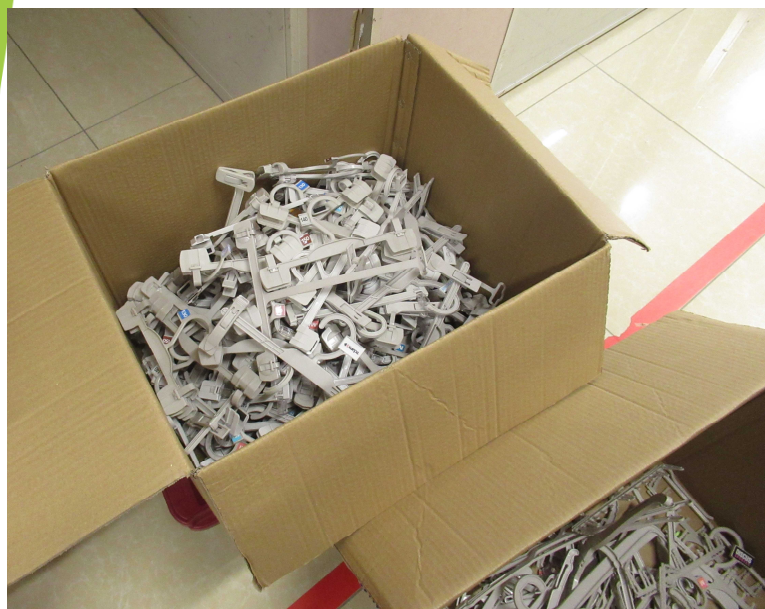
【再生されるハンガー】