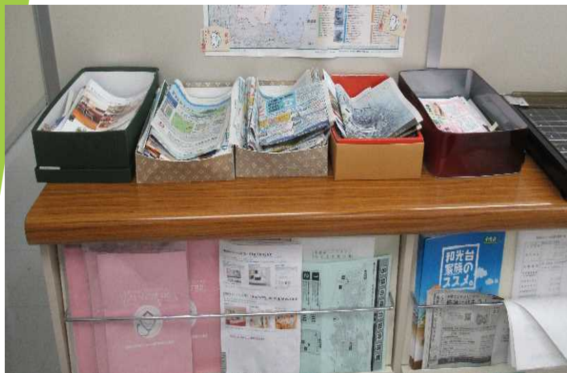
【オフィス内の古紙分別保管場所】