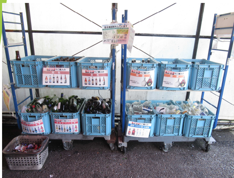
【空き瓶等回収コーナー】