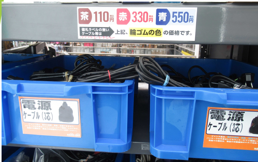
【値段を輪ゴムの色で表示する工夫】