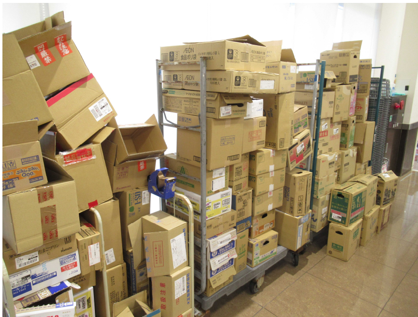
【買物客へ提供するリユース段ボール】