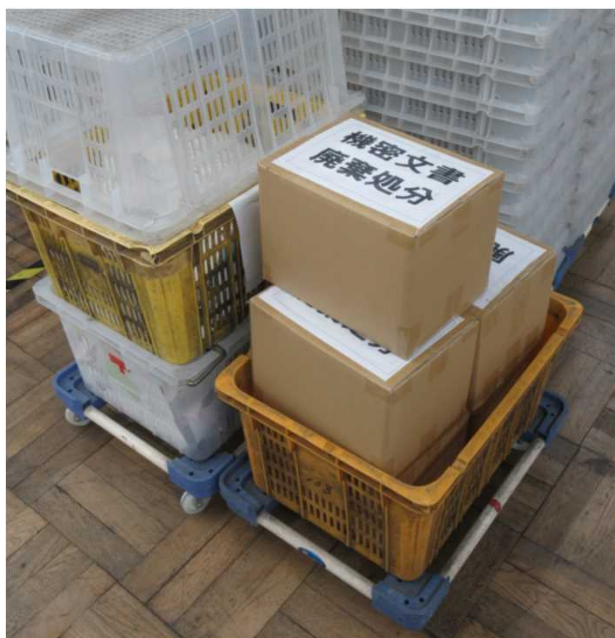
【資源化处理する機密文書】