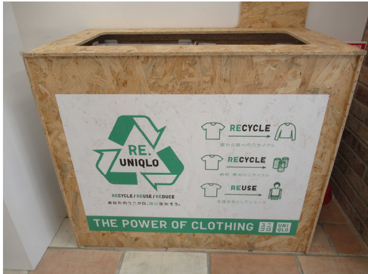
【古着回収ボックス】