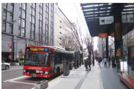
▲香林坊バス停(ラモーダ前)