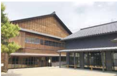
▲金沢学生のまち市民交流館