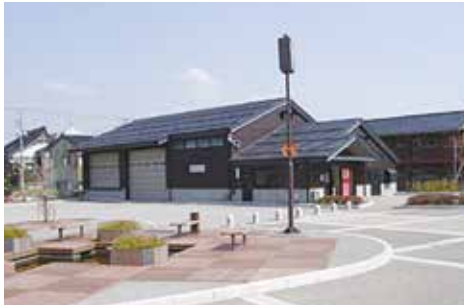
▲大和町防災拠点広場