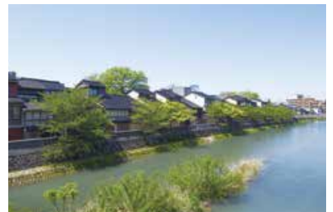
▲主計町重要伝統的建造物群保存地区