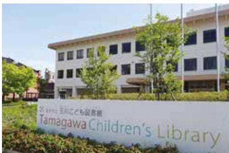
▲玉川こども図書館