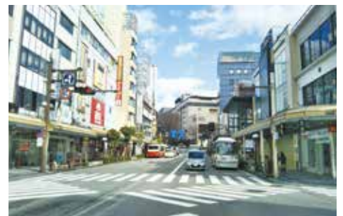
▲都心軸沿いの商業地