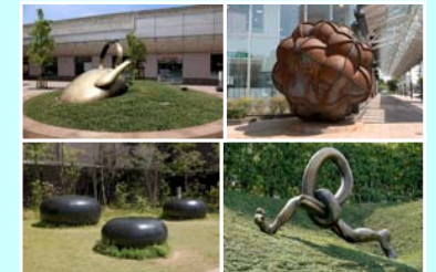
まちなか彫刻(提案事業)