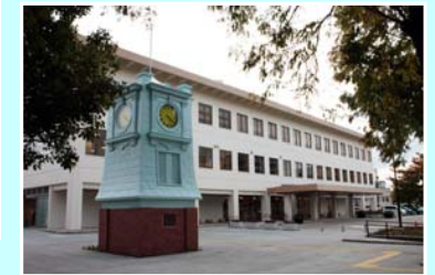
玉川こども図書館(基幹事業・提案事業)