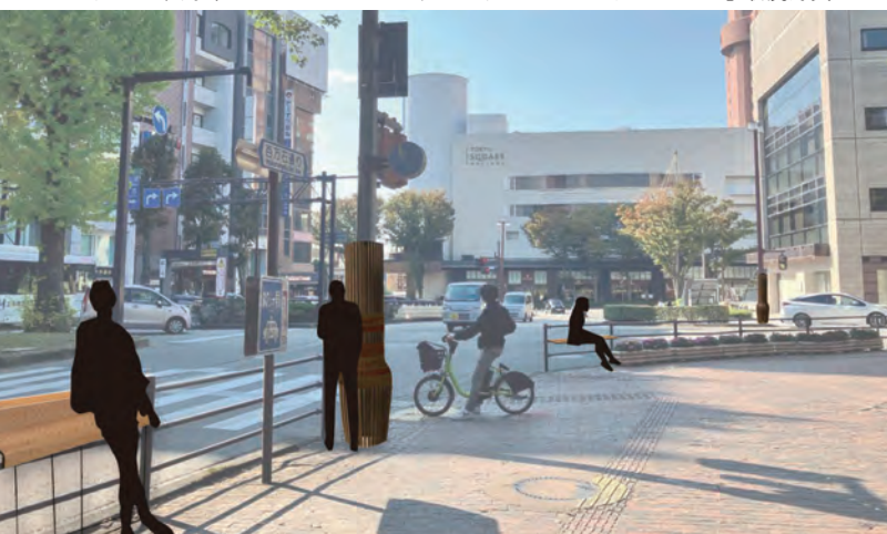
※過去の審査の内容については金沢市都市計画課HPを御覧ください。