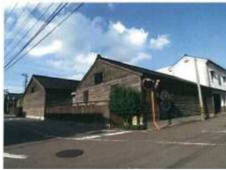
まちなみに溶け込む醤油蔵