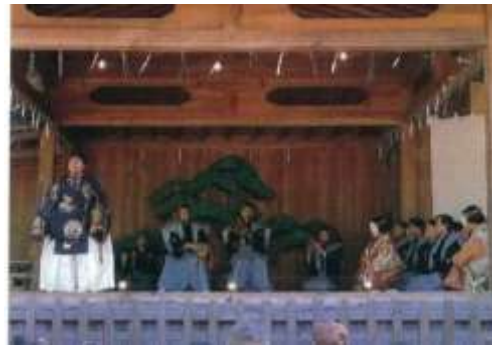
大野湊神社の寺中神事能