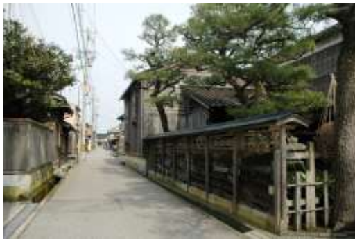
金石町こまちなみ保存区域

金石町区域は、加賀藩草創期から木材など物資の移出入を担う城下町金沢の流通の要地として重要な役割を担い、発展したまちです。近代以降、海上交通から陸上交通への物流体系の変化の影響を受けながらも、現在も、藩政期に由来する街路やまち割りが継承されるとともに、町家などの歴史的建造物が数多く分布し、こまちなみ保存区域に代表される歴史的な風情を残しています。また、古代の宮腰湊に起因し、市指定無形民俗文化財に指定されている大野湊神社の祭礼行事は、現在も盛大に執り行われるとともに、前田家との深い関わりがある寺中神事能も毎年開催されるなど、地域の伝統文化が色濃く継承されています。このように、金石町区域には地域の歴史や文化を映した貴重で、価値の高い景観が数多く残されています。