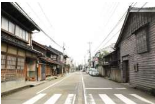
大野町こまちなみ保存区域

大野町区域は、藩政期に大野川から河北潟経由の水運を背景に発達したまちです。大野町区域の特質としては、加賀藩の政策として奨励された醤油製造業が、時代の変化に応じてその業態を適応させながら現在も受け継がれていることがあげられます。醤油製造業は、地下水に恵まれた立地性と、本区域の主要な生業であった廻運業の副次的な生業として始まりましたが、廻運業が衰退した後も醤油の生産は続けられ、現在は日本の5大醤油産地のひとつとして知られており、醤油製造工場や倉庫が特徴的な景観を創出しています。また、区域内の街路や町割は、藩政期に由来した基本的な構造を残しつつ、現代に継承されています。さらに、大野日吉神社の祭礼行事や市指定無形民俗文化財に指定されている山王悪魔払いなどの伝統行事が継承されています。このように大野町区域には、地域の歴史や文化を映した貴重で、価値の高い景観が数多く残されています。