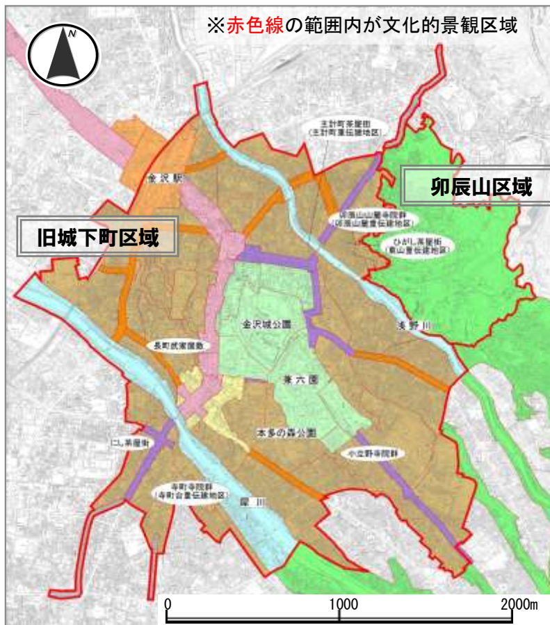
【金沢市の文化的景観】

本市における文化的景観区域は、下図に示すように、景観形成区域と整合を図った「旧城下町区域」、「卯辰山区域」、「金石町区域」及び「大野町区域」とし、景観形成基準に基づく規制・誘導により、歴史都市にふさわしい魅力的な景観形成を進めていきます。