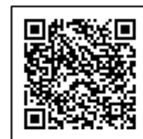
金沢電子申請サービス