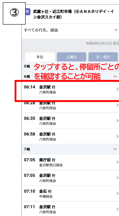
タップすると、停留所ごとの時刻表を確認することが可能