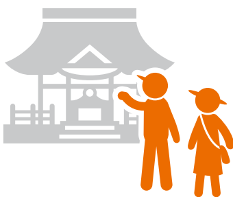
しらやまさんへ観光